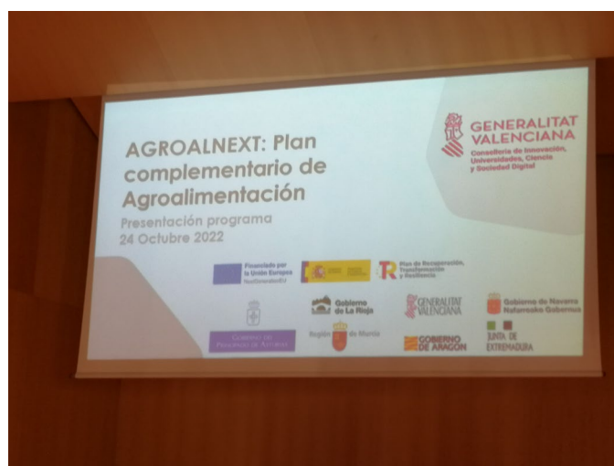
Presentación del Plan complementario de Agroalimentación GVA