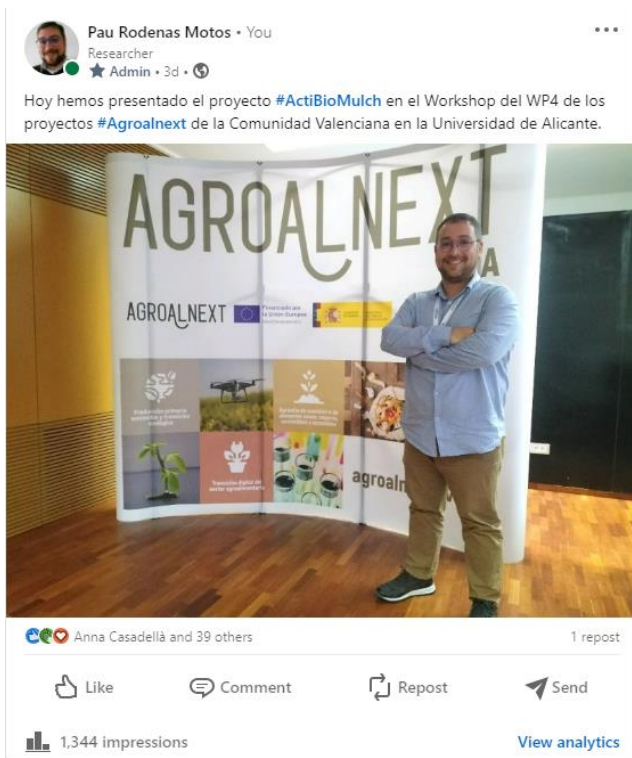
Imagen 3 Post de la reunión del WP4 de los proyectos Agroalnext GVA

En la red social twitter se ha realizado un tweet relacionado con la asistencia por parte