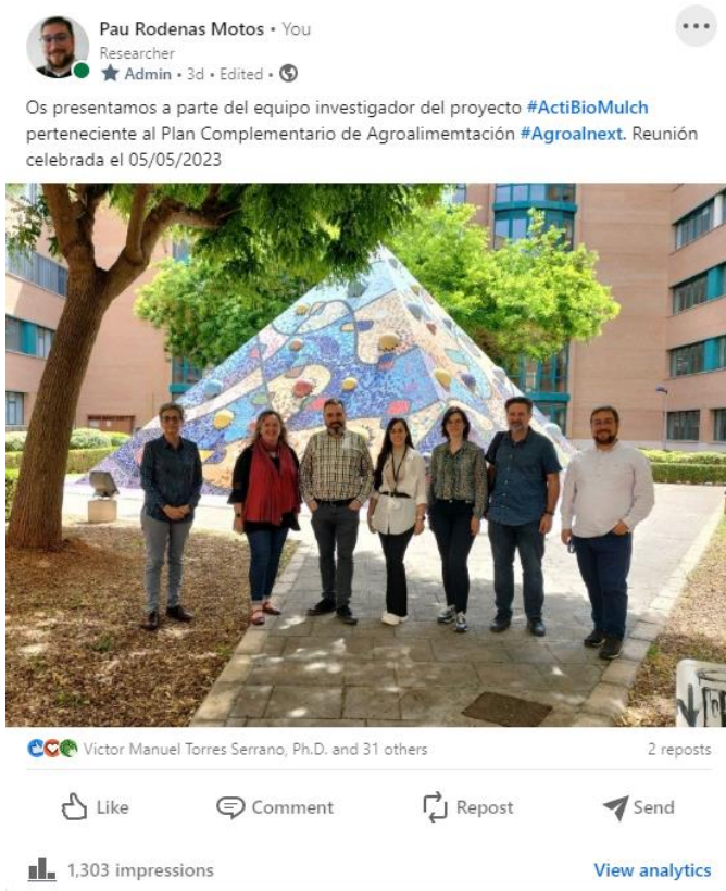
Imagen 2 Post en LinkedIn de la reunión del 05/05/2023