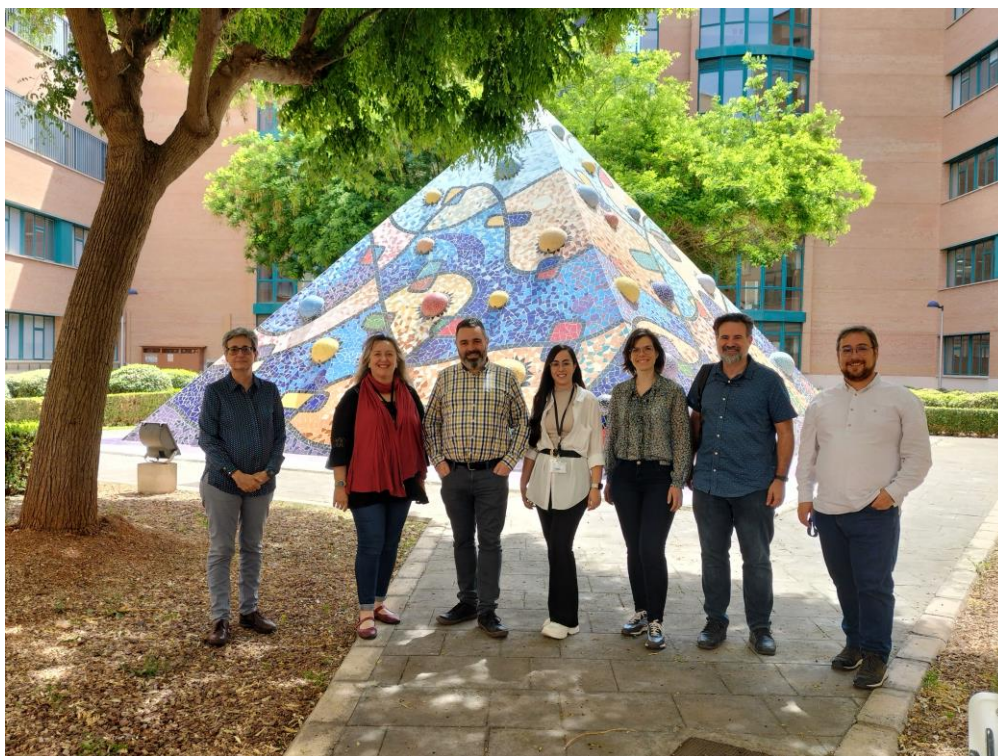
Imagen 5. Imagen del grupo de investigadores que participan en la reunión del 05/05/2023 del proyecto ActiBioMulch

Al finalizar la reunión se procedió a realizar una foto grupal que se utilizará para colgar en redes sociales.