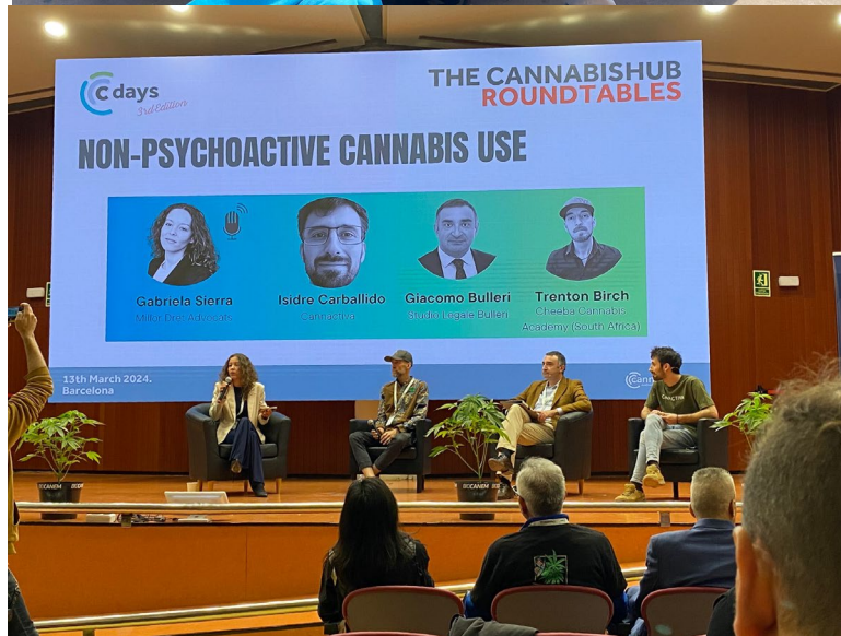
Imagen superior: Encuentro de alumnos del curso en Spannabis juntos con IP y PI del proyecto CANNADIG; Imagen inferior: Ponencia en Cdays (UPC).

Y para que conste a los efectos oportunos