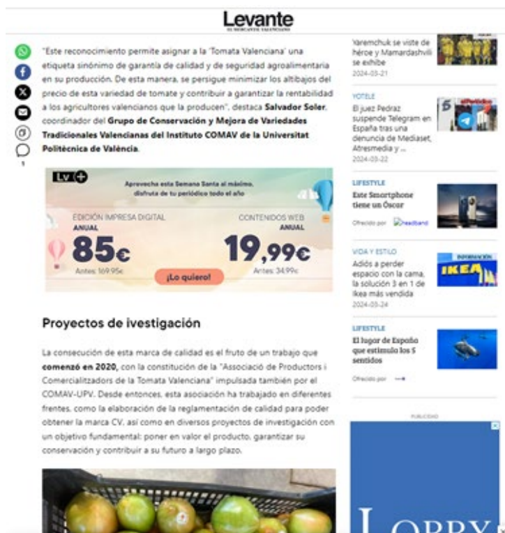
Figura 1.- Noticia en el periódico Levante sobre las investigaciones que se están realizando en el marco del proyecto MERESTOV