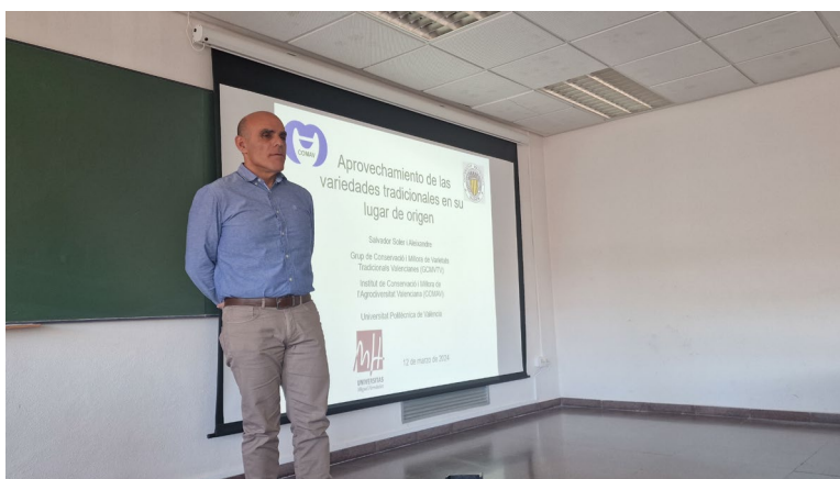
Figura 1.- Realización del seminario en la Escuela Politécnica Superior de Orihuela.