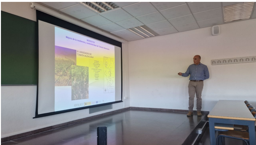
Figura 2.- Explicación de los trabajos realizados con la Tomata Valenciana en el marco del proyecto MERESTOV.

Y para que conste a los efectos oportunos