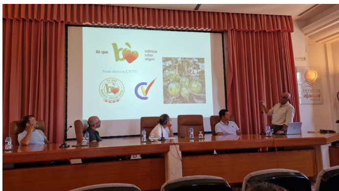
Figura 1.- Exposición de los trabajos en la Jornada sobre El producto de proximidad. Conservación de la Huerta de Valencia.