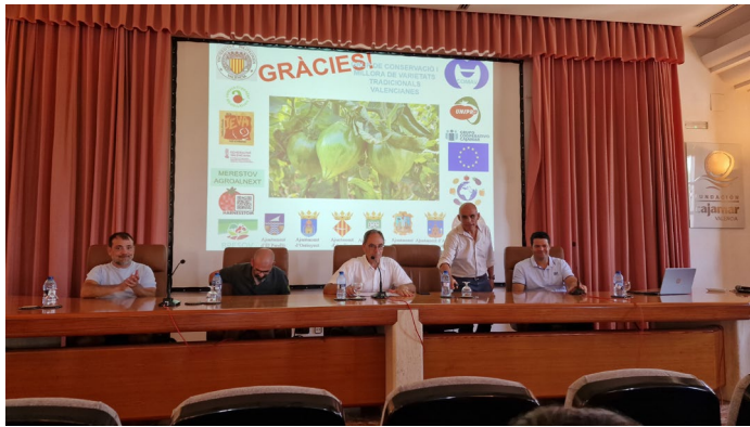
Figura 2.- Exposición de los trabajos en la Jornada sobre El producto de proximidad. Conservación de la Huerta de Valencia.