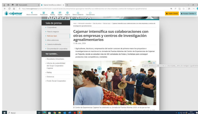
Figura 3.- Noticia en los medios sobre la jornada realizada 1.